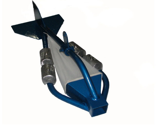
نمونه بردار بار کف ( با وزنه های سربی )

رسوب سنجی به همان اندازه آب سنجی اهمیت دارد.