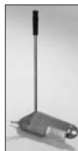
نمونه بردار دستی