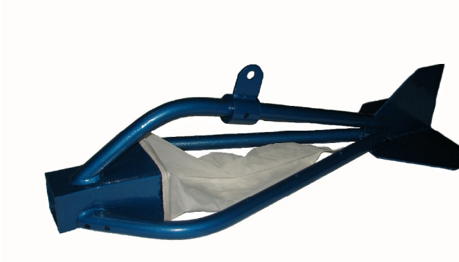
نمونه بردار بار کف ( هلی اسمیت )